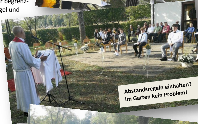
Abstandsregeln einhalten? Im Garten kein Problem!