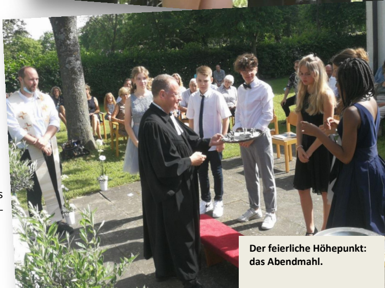
Der feierliche Höhepunkt: das Abendmahl.