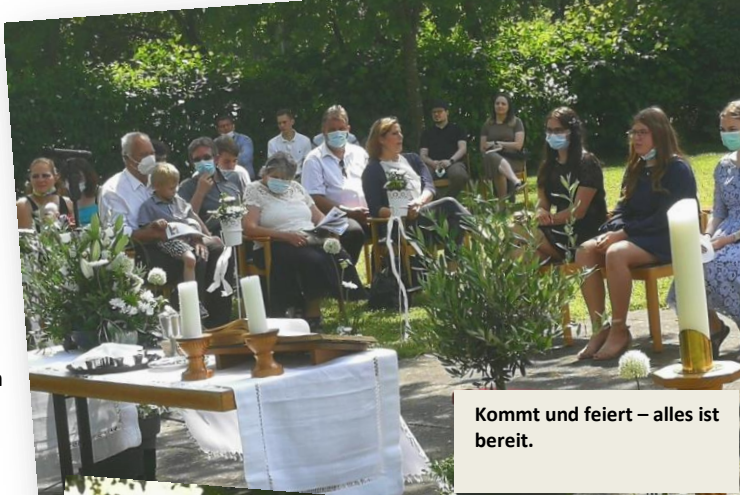
Kommt und feiert – alles ist bereit.

Ihr Einstiegs-Song, Mark Forsters „Chöre“, gab den Ton vor. Es ist ein Plädoyer, sich nicht kleiner zu machen als man ist – ein Lied, das Mut machen will, sich den Herausforderungen des Lebens zu stellen. Und darauf komme es an, meinte Pfarrer